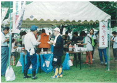
美味しいカレーに舌鼓