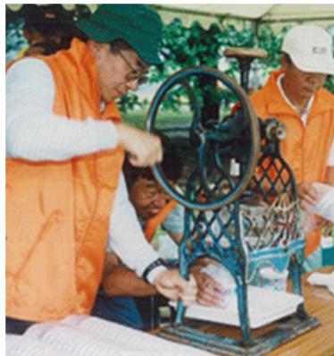
水土里ネット兵庫職員による カキ氷のサービス やはりこの時期はカキ氷ですね。