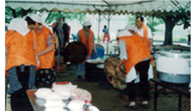
加西市婦人会の皆さんによる カレーライスの準備