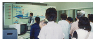
糶屋ダム操作室 配水状況を監視パネルにて説明