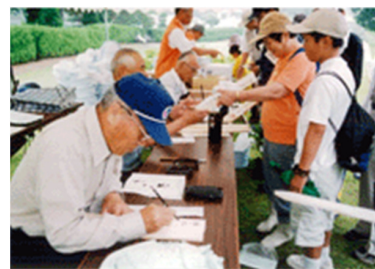
受付で記念碑の代筆