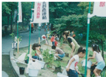
さあいよいよ！！植付け