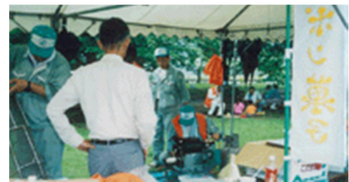
加西市地域振興部職員による ポン菓子製造