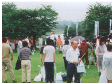
柏原理事長開催挨拶