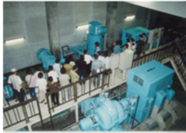
杉原川揚水機場にて ポンプの大きさにびっくり！！