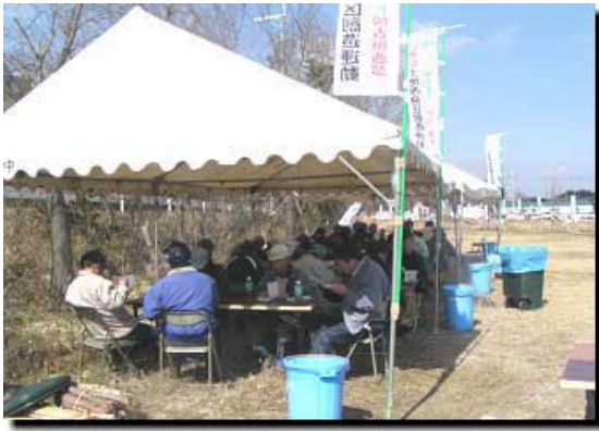
軽食の焼きそばに舌鼓しながら