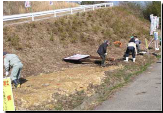
岩盤層のために案内看板の穴掘りは悪戦苦闘