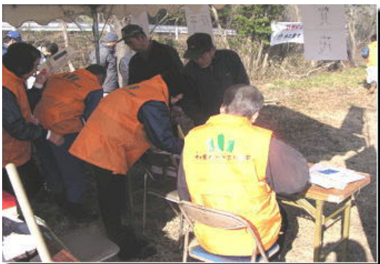
参加者の受付・参加記念品の配布