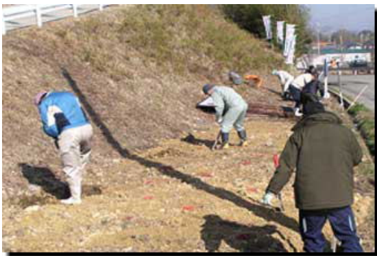
アジサイ植付位置の選定