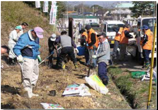
アジサイの植付も一段落