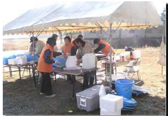
120名分の焼きそば準備に県・水土里ネット職員の応援をして頂き美味しく頂きました。