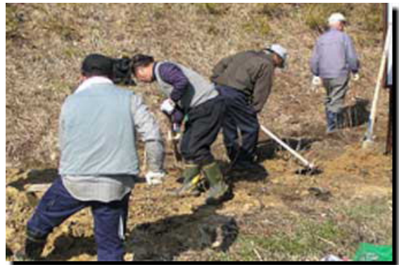
植え付け完了後整地作業