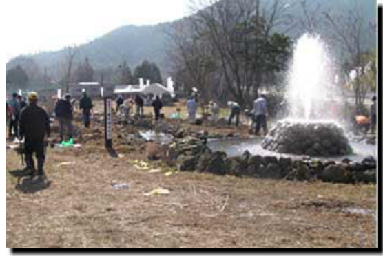
水辺空間を利用し噴水に改良した善防池分水口