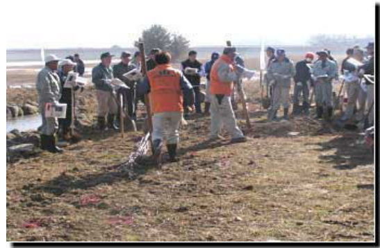
さくら植樹についての説明