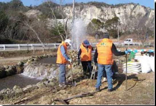
標柱設置穴掘に四苦八苦