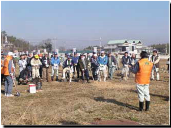
高田事務局長開催宣言・参加御礼