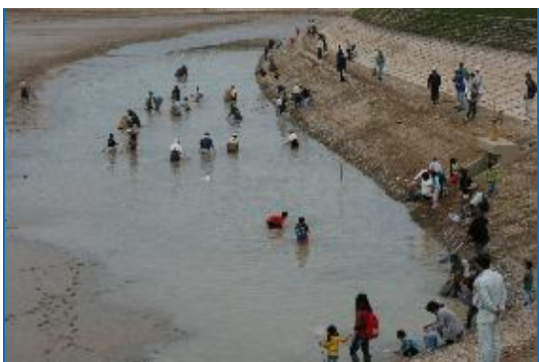
いよいよ雑魚獲り