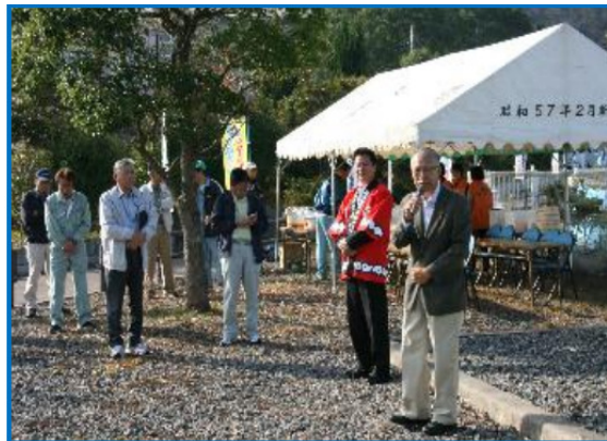
王子町区長のあいさつ