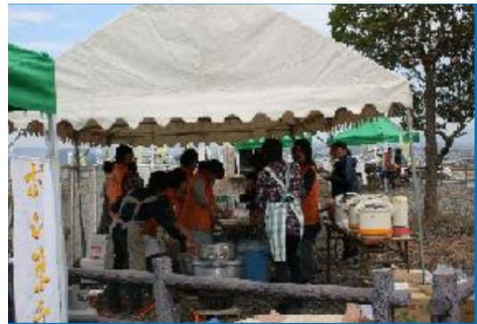
地元婦人会による炊き出し