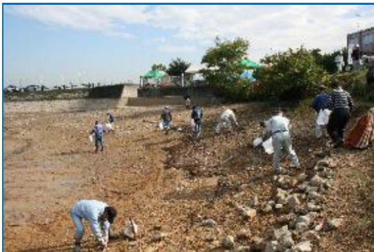
参加者によるため池周辺のクリーンキャンペーン