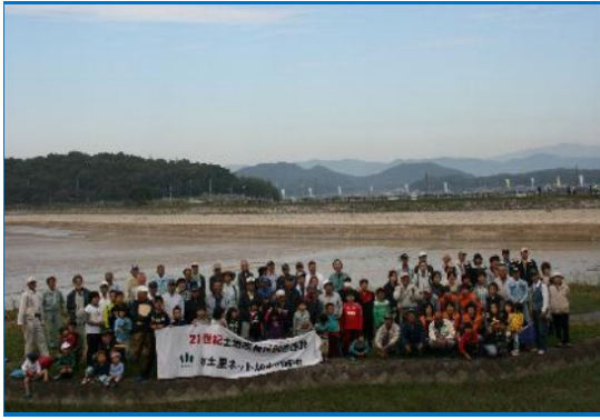
ため池オアシス運動参加者の集合写真