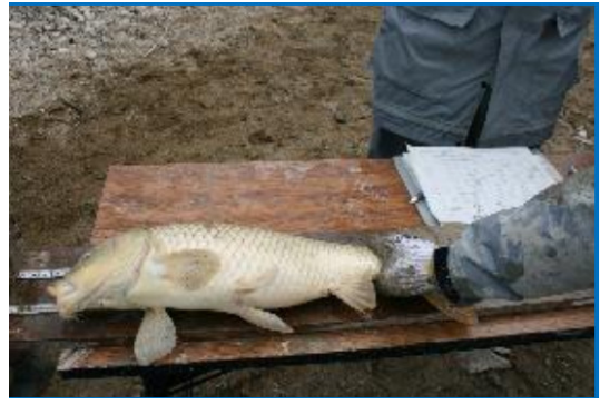
ため池オアシス運動参加者の集合写真