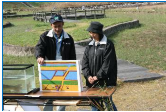
加古川流域土地改良事務所職員による紙芝居